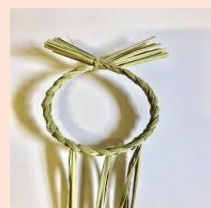
< 輪締め >

今年最後のイベントになります。もりの案内人と楽しくお正月飾りを作ってみませんか。門松は民間信仰として、お正月に歳神様がやってくるのでお迎えする目印としての役割があります。歳神様は特定の宗教や神様でなく、その年の福や徳を司る歳徳神や穀物の神、先祖の霊など複数の神様の集まりです。飾るマツは長寿の意味が込められています。